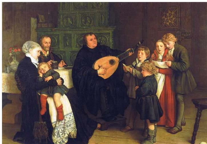
Een van die latere voorstellinge van die singende Luther-gesin tydens aandgodsdien, met Melanchthon in die agtergrond.

Melanchthon was die eerste “dogmatikus” van die Protestantisme. Hy was egter ook “praktiese teoloog” wat die kerk leer bid het. Hierbo is genoem dat talle van sy gebede in liedtekste omskep is. Een van sy belangrike bydraes op hierdie terrein het met “aandgebede” te make. Een van sy aandgebede, gebaseer op die gebed van die Emmausganger in Lukas 24:29, Here bly by ons , is deur verskeie komponiste deur die loop van die eeue getoonset. Die Afrikaanse woorde van vespera iam venit lui: Netnou is die aand hier, bly daarom onder ons, o Christus, sorg daarvoor dat u lig nooit onder ons uitgedoof word nie . Ons sal seker nie verkeerd wees nie as ons beweer dat ons geliefde Gesang 582 se diepste wortels terugstrek tot by Melanchthon. Ons betrek hierdie woorde grootliks op die dood, terwyl Melanchthon dit weer betrek op elke dag se opstaan en stryd om die behoud van die geloof.