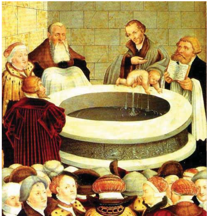
Philipp Melanchthon doop 'n kind. Altaarskildery in die Stadskerk in Wittenberg deur Lucas Cranach

Melanchthon besef dat die Drie-eenheid vir baie mense 'n verwarrende aangeleentheid kan wees. Om hierdie rede probeer hy nie om hierdie leerstellige saak vir lidmate met moeilike argumente te verduidelik nie. Hy beveel aan dat lidmate eerder hul eie doop moet probeer verstaan. Die doop is vir Melanchthon die indrukwekkendste en belangrikste seremonie van die kerk. Hoekom? Omdat die doop die beloftes van God tot uitdrukking bring. By die doop word groot en klein belowe dat God die Vader sal voorsien; dat God die Seun sal vergewe; dat God die Gees sal vernuwe en tot nuwe lewe sal wek. Van hierdie dinge weet die heidene niks, aangesien hulle nie die sakrament ontvang nie en nie onder die geklank van die Woord kom nie. Aangesien die kerk die evangelie van die drie-enige God nie geheim wil hou nie, moet hy mense uitnooi om gedoop te word en om hul geliefdes te laat doop. Die doop is die teken en waarborg dat ons met 'n lewendige God te make het wie se wil pure genade en barmhartigheid is. Om hierdie rede is Melanchthon se oordeel seker reg: Wie nie gedoop wil word nie, wie met ander woorde nie die liefde van die drie-enige God wil ervaar nie, bevind hulle buite die kerk.